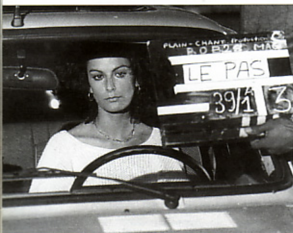
Lors du tournage d'un film canadien.

Oui. J'ai eu un trac fou. Pire qu'en montant sur scène. Maintenant, cela dure depuis quatre ans, et il se passe toujours la même chose. Autrefois, à chaque fois que je montais sur scène, je me disais : « Demain j'arrête. » Et maintenant chaque fois que j'anime, je me dis « Il faut que je trouve un autre métier. » Mais au bout de quelques minutes, c'est fini, il y a la lumière qui passe, il y a le potentiel dont l'autre est porteur que je reçois. Que je reçois et